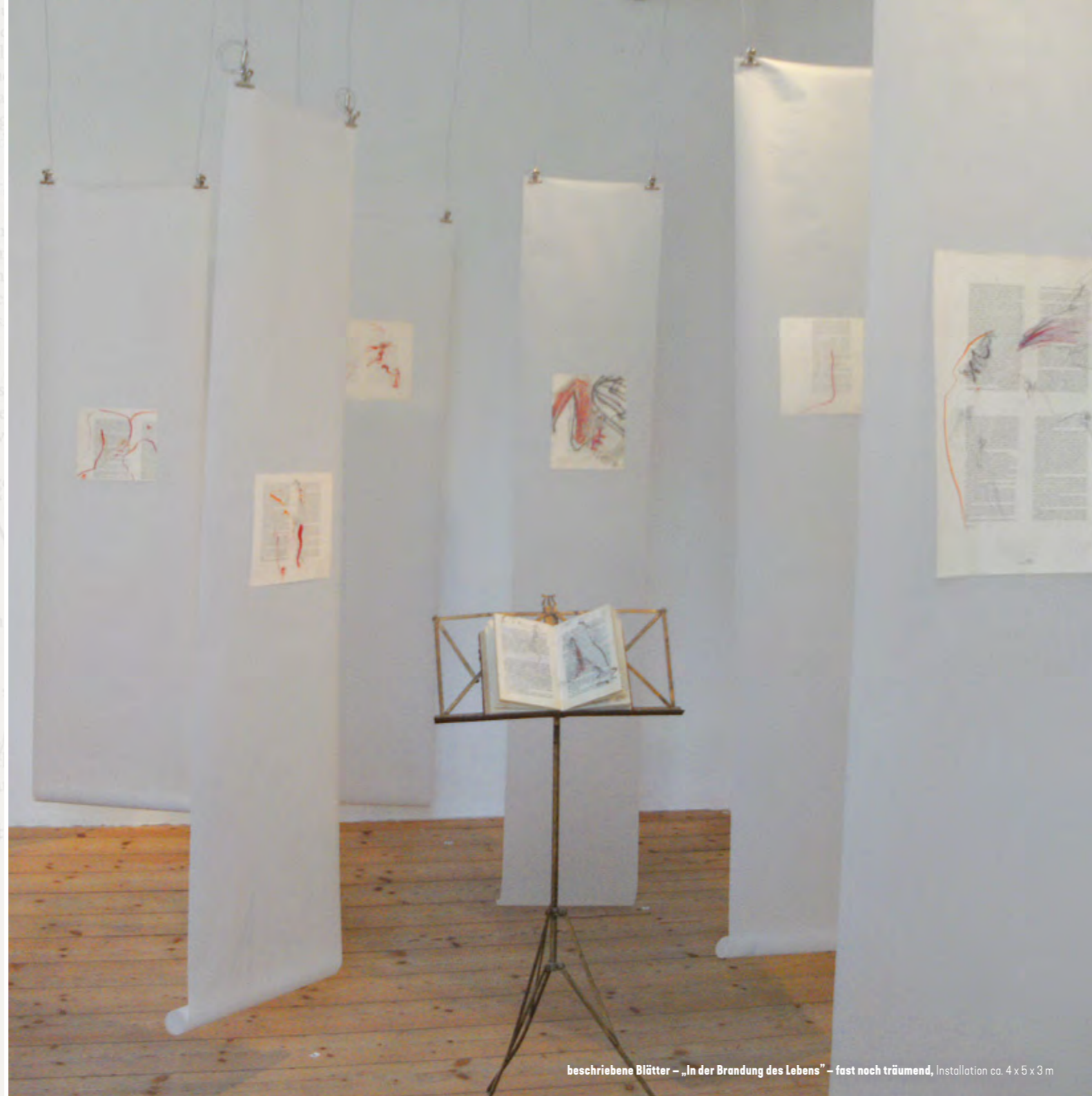
beschriebene Blätter – „In der Brandung des Lebens“ – fast noch träumend, Installation ca. 4 x 5 x 3 m