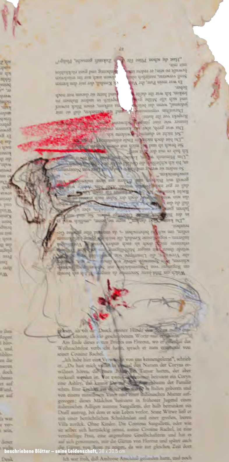
beschriebene Blätter – seine Leidenschaft, 38 x 30,5 cm