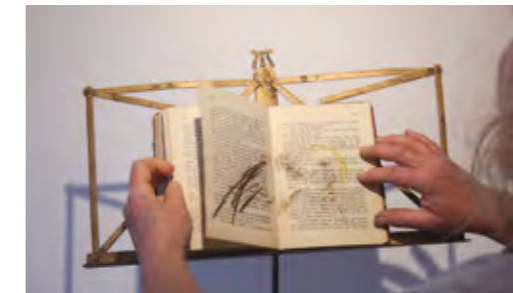
„In der Brandung des Lebens“ – fast noch träumend, ca. 17 x 24 cm