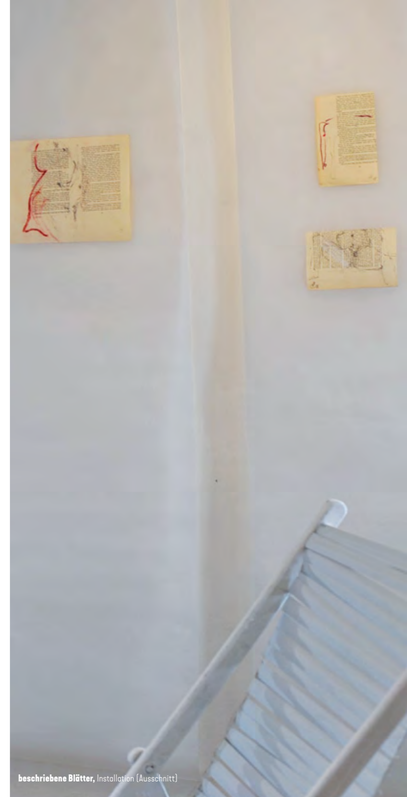
beschriebene Blätter, Installation [Ausschnitt]